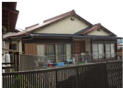
西学童にじ（民家借用）