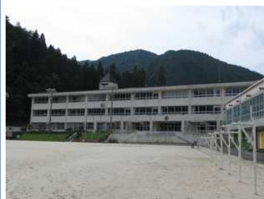
付知北学童（小学校空き教室）