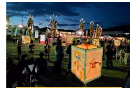
苗木あんどん祭り (8/14)