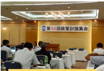
連合岐阜政策討論会 (7/26)