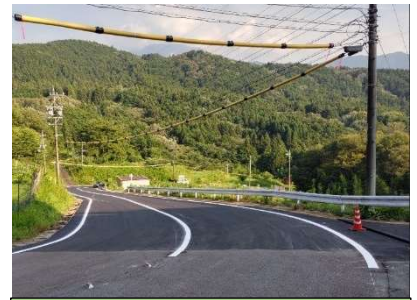
復旧工事が完了した市道 向山~新茶屋線(落合地区)

議会が議決しなければならない案件を、緊急な場合などに市長が代わりに意思決定することで、次の議会で審議が行われます。