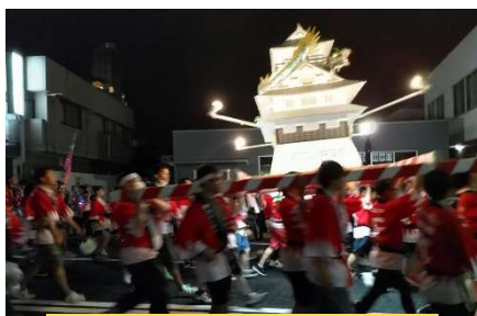
おいでん祭 本祭り (8/13)