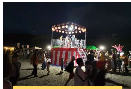
落合ふるさと祭り (7/29)