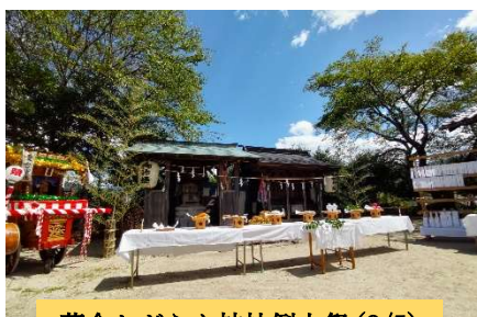
落合おがらん神社例大祭 (8/5)