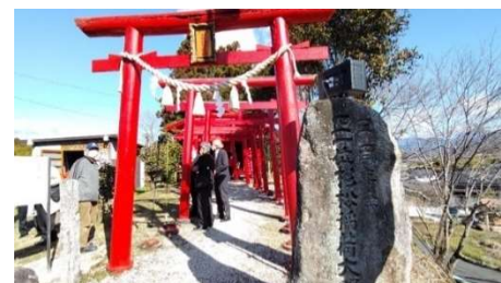
落合杉松稻荷祭典 (3/10)