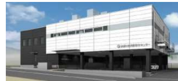
瑞浪市に建設される消防指令センターのイメージ図