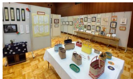
中央公民館まつり (2/25)