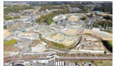
リニア駅周辺整備