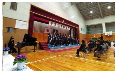
苗木中学校卒業式 (3/8)