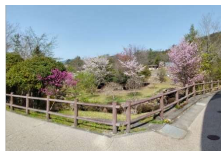
夜明けの森ツツジまつり (4/14)