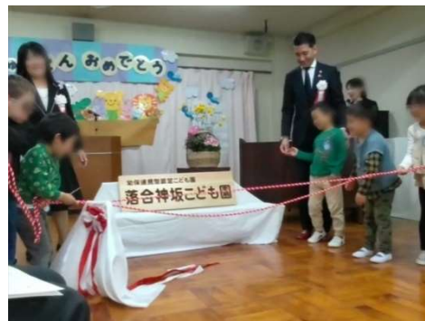
落合神坂こども園 開園式 (4/8)