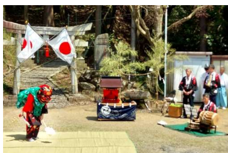
白山神社例祭 (大久手獅子舞の奉納) (4/14)