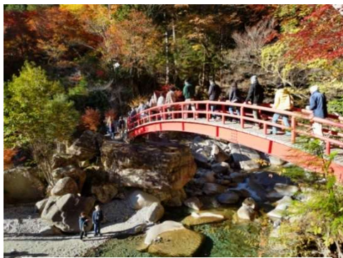
もみじまつりで賑わう夕森公園

※上記と同時に募集された「道の駅 五木のやかた・かわうえ」は応募者が無く、市の直営でトイレ・休憩室のみ運営する事になりました。