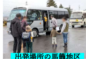
出発場所の馬籠地区

令和8年度の統合に向け、令和5年秋から両地区で統合準備委員会を設立して協議が進められてきました。11月には7回目の委員会が開催され、PTAの規約改定案やスクールバスの運行時間、落合小中学校の改修状況等の報告と、今後のスケジュール確認が行われました。12月の定例会では、学校の設置に関する条例改正の議案も審議され、準備も最終段階となっています。神坂小学校の児童がスクールバスで登下校するシミュレーションも行われ、登校の様子を確認してきました。乗車に手間取り僅かな遅延はありましたが、大きな問題も無く安心しました。残務の道路拡幅工事やスクールバスの納入等に遅れが出ないように、引き続き確認して参ります。