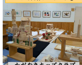
かがやきキッズクラブ 作品展 (12/13)