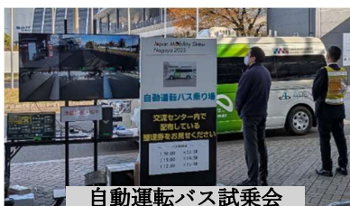
自動運転バス試乗会

中津川市をはじめ、各地の公道で実証実験が行われています。会場でも試乗会が行われていましたが、現在は人による周辺監視などの補助が必要な「レベル 2」です。これは自車が周囲の情報をセンサーやカメラで収集する方式では、死角ができてしまうことや、周囲の人や車両の動きを予測する技術が人間のレベルに達していない事が課題とされています。各メーカーが課題解決に取り組む中で、「あいち ITS ワールド」のブースでは、これを補う方法として大学の研究室が取り組んでいる、画像処理や人や車両の位置情報を共有する方法などが紹介されていました。