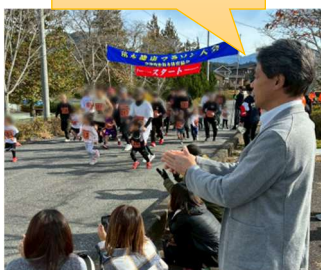
苗木健康マラソン (11/23)