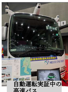
自動運転実証中の高速バス