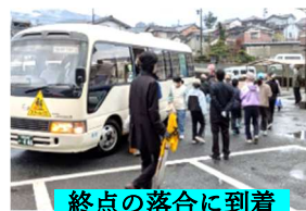
終点の落合に到着