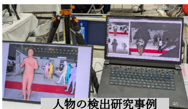
人物の検出研究事例