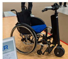
手動車いすの電動化

大阪万博でも注目されていたようですが、身近な物ではシニアカーや電動キックボードなど、短距離を 1~2 人で移動する電動車です。自動車メーカーだけでなく、電機メーカーなど異業種も参入し、立ち乗りや車いすに取り付けるタイプなど、新たな提案がありました。