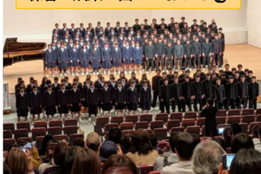
苗木中学校合唱祭 (11/28)