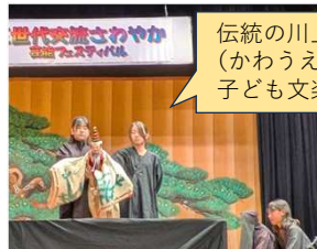
中津南3世代交流さわやか 芸能フェスティバル (2/1)