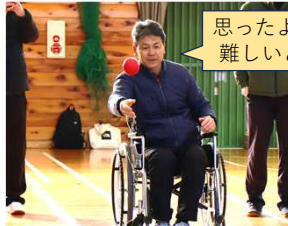
デンソーテン ボッチャ大会 (2/1)