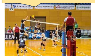
Vリーグ女子 中津川大会 (2/8)