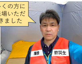
落合地区 防災体験フェア (1/25)