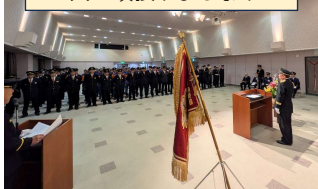
消防団辞令交付式 (4/1)