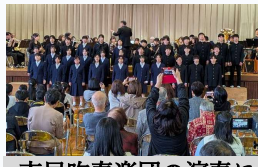
市民吹奏楽団の演奏による中学生の校歌斉唱