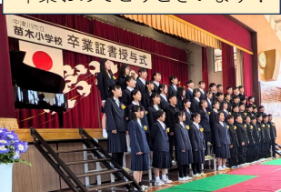
苗木小学校卒業式 (3/24)