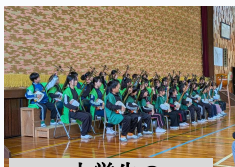
小学生の三味線演奏